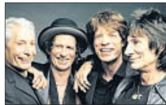
Schon wild auf Blumenthal: Die Rolling Stones, die mit ihrer Anwesenheit den Bestand des Altenheims sichern werden.

lem Körpereinsatz dabei“, zeigte sich die Symbolfigur der 68er Bewegung entzückt.